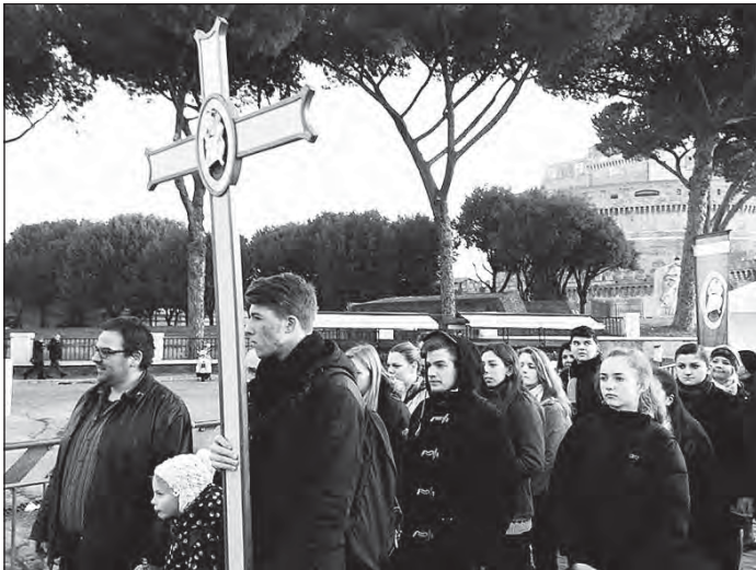
Bevonulás a Szent Péter Bazilikába

tartjuk. Január 22-e a magyar kultúra napja, ezen a napon iskolánkban hagyományosan egy osztályok közötti kulturális vetélkedő első fordulója zajlik. Minden évben egy kicsit más a feladat, eddig már sütöttünk, énekelünk, illusztráltunk, szaval-