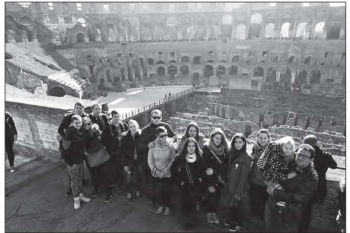
Diákok, öregdiákok, tanárok Rómában

Új év kezdődött, de a régi emlékeit is őrizzük. A decemberi versenyeket: az általános iskolás diákok számára kiírt rajzpályázatot és helyesírási versenyt, melyeket nagy érdeklődés fogadott. Sok szép rajz érkezett, melyek közül nehéz volt kiválasztani a legkifejezőbbeket, sok jó helyesíró jelentkezett megmutatni tudását. Az örömeny vetélkedőt sem felejtjük, melyen a 10.a osztály csapata vett részt és csak hajszálon múlt a továbbjutásuk. A versenyre való felkészülésük során eddig ismeretlen világ tárult a szemük elé.