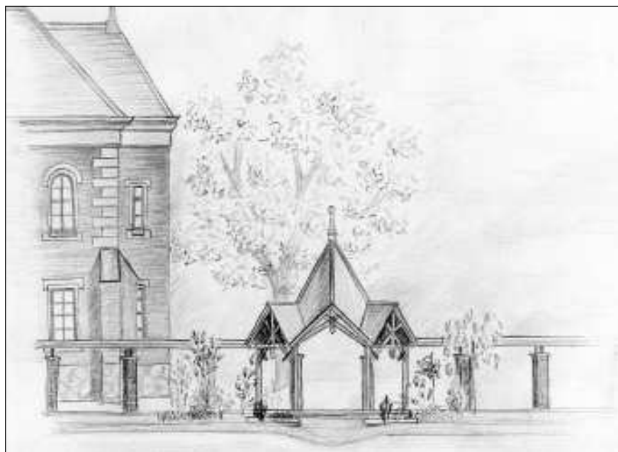
A dísztéri házasságkötő pavilon látványterve

nak a második fordulóban számos feltételt kell teljesítenie. E feltételek (pl. végleges Integrált Városfejlesztési Stratégia elkészítése, projektfejlesztési útvonalterv benyújtása) teljesítése érdekében természetesen mindent megtesz a város vezetése.