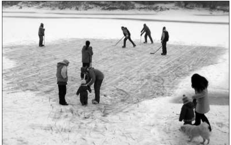
Egy kis korcsolyázás január 11-én

Március 3-án lakossági fórumot tartottunk, és április 2-a környékére