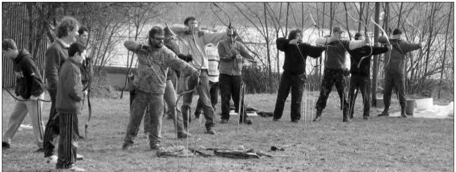
Vasárnaponként 14 órától a szobi Luczenbacher kastély kertjében íjászkör összejövetelt tartanak

Aki csatlakozna hozzánk, jelentkezzen e-mailen, a szob.szovetseg@gmail.com címen, vagy a 70/27-27-672-es telefonszámon.