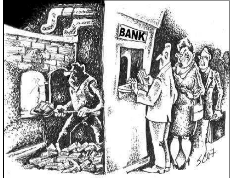
Most akkor kinek kell kit segíteni?

Úgy tűnik, hogy a pénzügyi válságról szóló korábbi információink hamisak voltak. Kezdetben a hazai bankok sürgős állami meg-