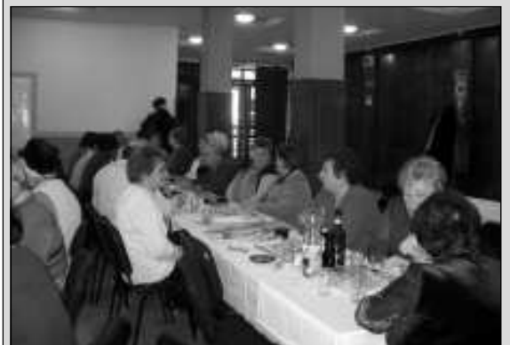
Március 8-án nőnap alkalmából köszöntöttük a nyugdíjas klub hölgy tagjait

Szépséges nők, Jó asszonyok, Kívánunk boldog, Víg nőnapot.