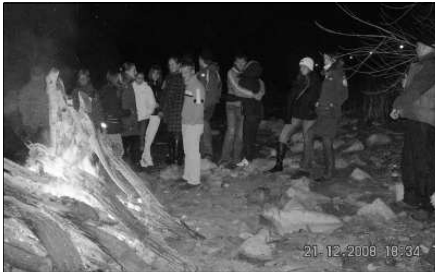
December 27-én Szob is bekapcsolódott a fényláncba

Kurultaj filmvetítést ( www.kurultaj.hu ) a művelődési házban.