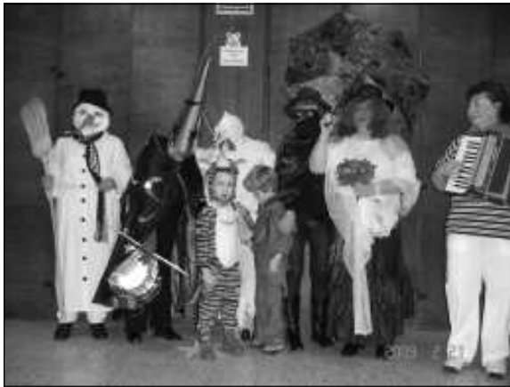
Fergeteges tapsot kapott a Varázsló, a Zorró, a Fehér kakas, az Eszmeralda, a Márió és a Hóember

A bál kezdetére megtelt a művelődési ház részünkre biztosított helyisége. A kinti hideg idő ellenére kellemes meleggel vártuk a klub tagjait. Rendezvényünket a zebegényi vendégeink is megtisztelték jelenlétükkel. Az érkezőket kellemes, az időseknek ismerős zeneszámok szórakoztatták. A megjelentek meghitt baráti beszélgetéssel és a zene hallgatásával töltötték az időt, közben fogyasztva a felkínált szendvicseket és a hazai süteményeket. Már jó han-