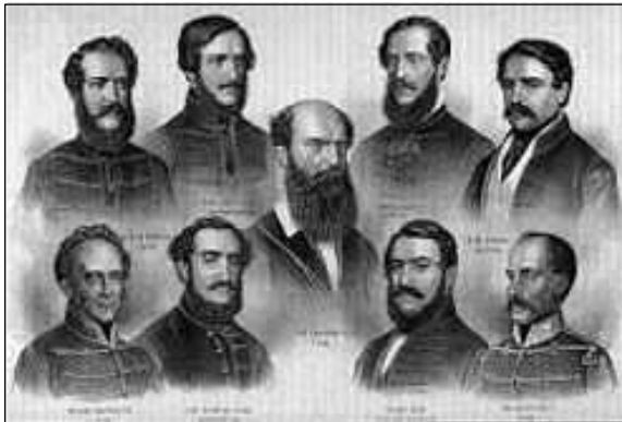
A Batthány-kormány, Magyarország első független, felelős kormánya

“Mi lenne belőlünk egyéb, mint dicső nemzet, mely hamvaiból kiemelkedve, mikor egész Európa bomladozik, az emberiség dicsőre úgy fog állni most a rend, a béke és szabadság fölött őrt, valamint hajdanta a kereszténységnek volt védőfala.” (Gróf Széchenyi István: Mi lesz belőlünk magyarokból, 1848. )