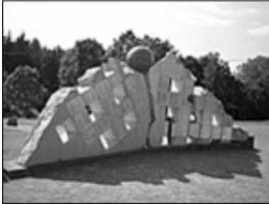
A recski munkatábor emlékműve

Ma már sokan vannak, akik nem éltek még abban az időben. Az ő számukra vagy megmásítva, vagy szinte teljesen elhallgatva tartják homályban a történeteket. Sajnos Magyarország is szenvedője volt a világméretű kommunista ámokfutásnak. A történetek elhallgatása, megmásítása súlyos problémákat szülhet a