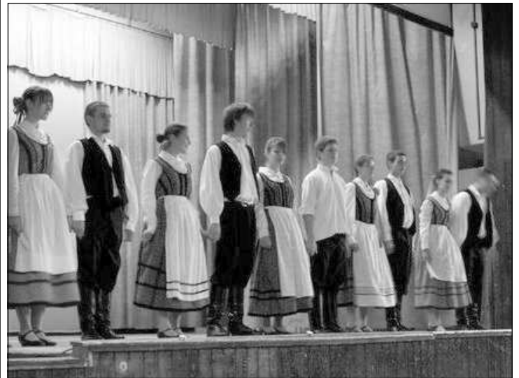
A gimnázium diákjai a trianoni békediktátum aláírásának 89. évfordulójáról emlékeztek meg a művelődési házban

Műsorunk keretén belül elhangzottak a szebbnél szebb versek mellett, a szomorú eseményről megemlékező íráskok is. Az iskolánk egyik történelem tanára színvonalas előadást