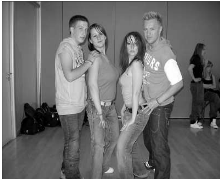
A versenyen résztvevő csapat tagjai