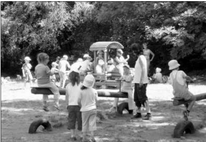
Az ovisok nagyon élvezték a kirándulást

A leterített pokrócokon ettek-ittak, majd rövid kirándulásokat tettünk a környéken. Kitaposott ösvényeken sétáltunk, láttunk lovakat, csendben megnéztük a horgászokat, a vízbe