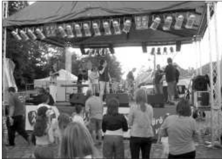
A Bon Bon együttes városnapi koncertje