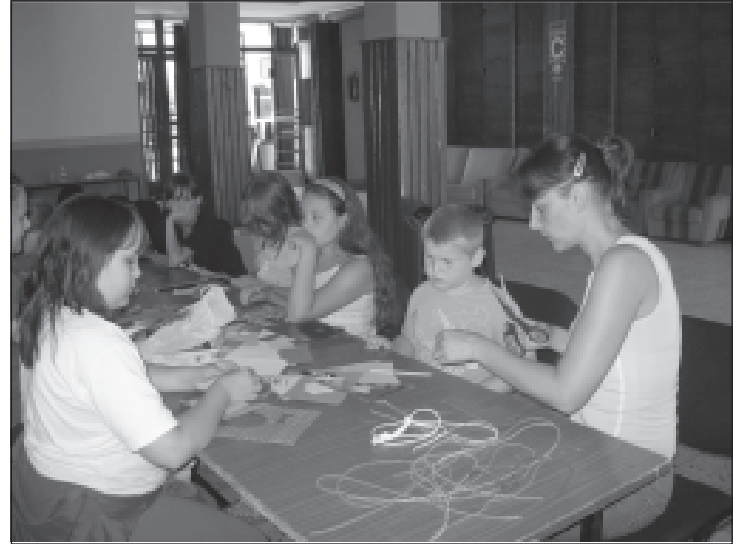
Kézműveskedés a művelődési házban

sporthatott vagy kézműveskedhetett. Összemértük erőnket sportversenyekben is. Idén az árvíz miatt a már megszokott élő társasjátékunkat a Duna-part helyett a művelődé-