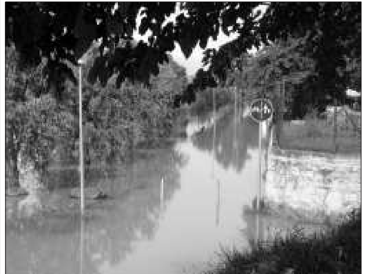
Az elöntött kerékpárút

Az árvíz az előrejelzéseknek megfelelően a rendezvényt sorozat ideje alatt érke-