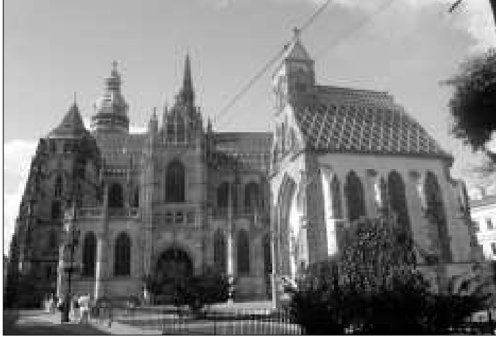
A kassai dóm