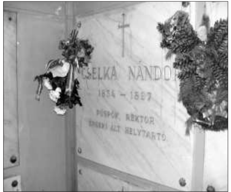
A helytörténeti szakkör tisztelgése - 2008 november

1878-ban fővárosi bizottsági taggá, 1882-ben a budapesti egyházkerület esperesévé majd