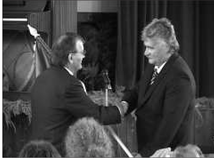
A Millenniumi Zászló átadása