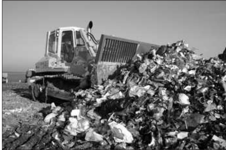
Bezárásra kerül a hazai hulladéklerakók mintegy kétharmada (képünk illusztráció)

Az önkormányzat hónapok óta kereste a megoldást arra, hogy a hulladéklerakók bezárásával előálljon új helyzet a lehető legkisebb mértékben terhelje meg anyagi szempontból a lakosságot. A tárgyalások eredményeképpen kialakult legkedvezőbb megoldás szerint, esetünkben a jövőben elválik egymástól a hulladékszállítás, illetve a hulladékgemmisítés. A hulladékszállítást továbbra is heti rendszerességgel a Maros Építőipari és Kommunális Kft. végzi, azonban a hulladék megsemmisítésére ASA Kft. tette a legkedvezőbb ajánlatot. Mindennek megfelelően a normál 110 literes kuka esetén 19.600. Ft lesz éves szinten a szállítás és a megsemmisítés