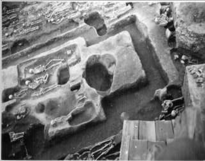
Sírok templomon belül és kívül

A hajózási meder ebben az időben nem a sziget és Helemba között volt, hanem a túlsó (Esztergom – Búbánat-völgy) felőli oldalon, így valószínűleg gázló is lehetett a falu és a sziget között. A másik különös középkori jelentősége a szigetnek, hogy nem akármilyen gyümölcsöt telepítetett ide Leodiumból (ma Liege) származó Róbert esztergomi érsek, ugyanis egy a kikötőbe és piacokra szánt oklevél szól arról, hogy életével fizet az a személy, aki innen gyümölcsöt lop. Vajon milyen lehet az a gyümölcs, amelynek ellopásáért halálbünt-