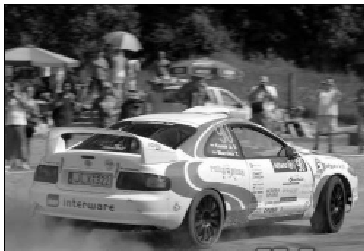
Öt gyorsasági szakasz, majdnem 25 kilométeres össztávval egésznapi kikapcsolódást ígér

pen élményekben és vidámságban gazdag szombatot garantál. Kivétel nélkül minden rallykedvelőt szeretettel várnak a rendezők, hiszen ez nem a profik futama. Aki egy kicsi készletet is érez, hogy kipróbálja magát, annak ott a helye. Egy biztos: minden induló megtudhatja, hogy mire képes, hiszen egy lezárt pályán tekerheti a kormányt,