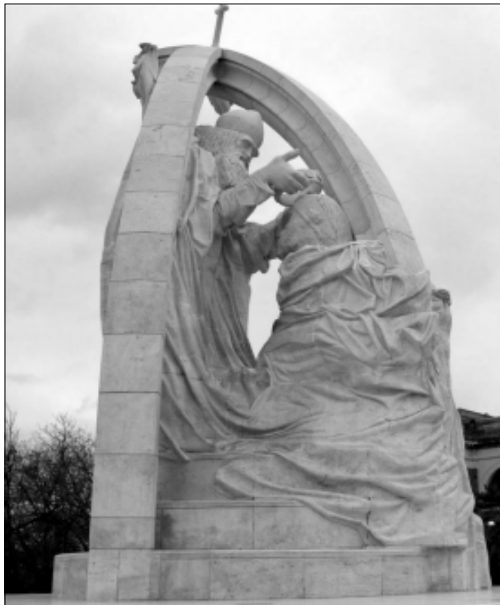
Szent István megkoronázása. Melocco Miklós monumentális szobra az esztergomi vár északi rondelláján áll

teleződés, amely Szent István király országépítő tevékenységét, mentalitását meghatározta, milyen szerény mértékben van jelen ma Magyarországon. Rendben van, színes ez a világ, más hitek és életfelfogások között a korábban oly meghatározó szerepet betöltő kereszténység ma egyetlen színfolt a palettán.