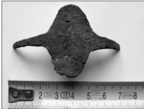
Középkori dunai hajókon használt iszkába-szeg