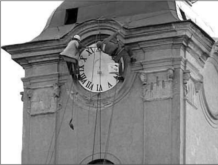
A helyére került a felújított számlap