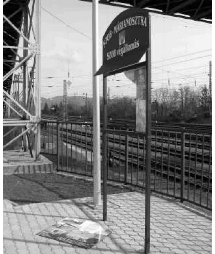
A tönkretett hirdetőtábla

EZT A TÁBLÁT VALAKI(K) MÁRCIUS 26-ÁN REGGELRE SZÉTTÖRTEK!