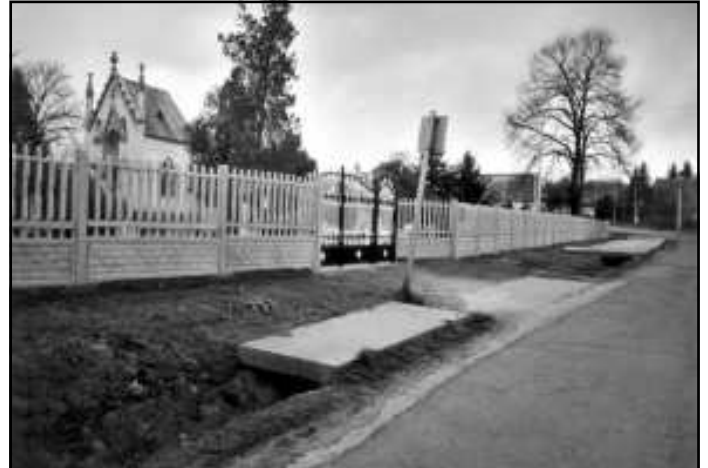
A közadakozásból megépült temetőkerítés