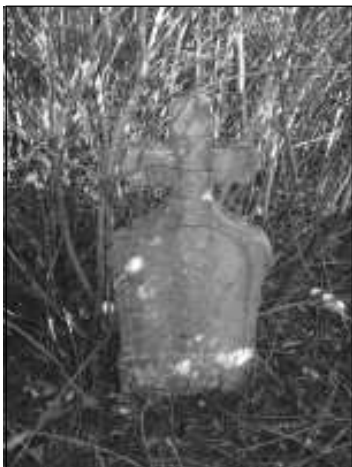
A sír 2006-ban

szám) vajon testvérek voltak-e. A koszorú elhelyezése után megható pillanatok következtek: a legkisebbek, az ötödikesek – nem előre „megírt forgatókönyv szerint” – egy-egy szál élővirággal és gyertyagyújtással emlékeztek a 101 éve örök álmát alvó honvéd-