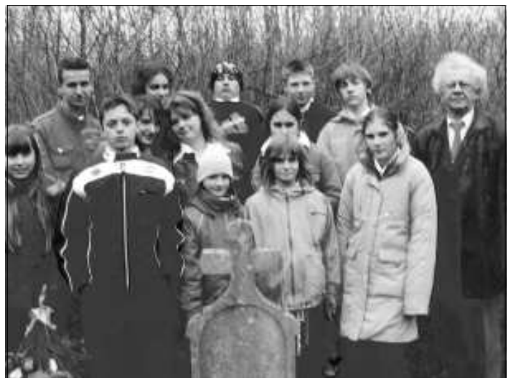
A megemlékezés résztvevői

Nos, tanítványainkkal ez utóbbi sírt próbáltuk megtalálni 30 évvel falukutatónk fel-