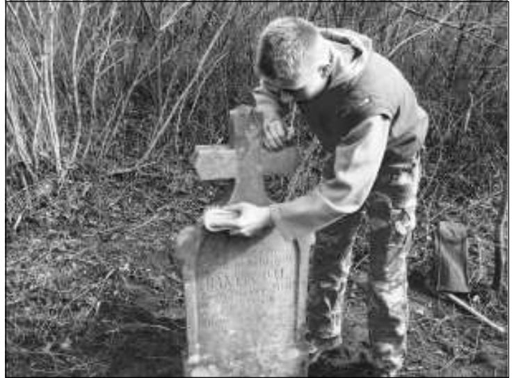
A síremléket tisztítása