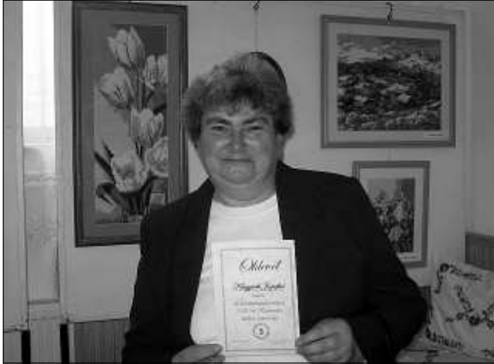
Minden kiállító emléklapot kapott

díjas klub néhány tagja volt. A kezdeményezést visszaigazolta, hogy az idén közel harmadával emelkedett a kiállítók száma.