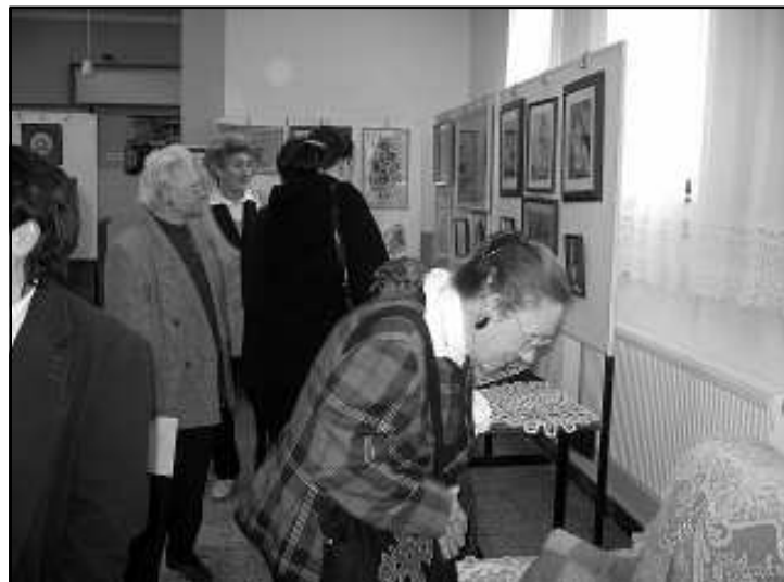
A látogatók érdeklődéssel szemlélték a kézimunkákat

doboz és dísz tárgy stb. felsorolni is nehéz őket.