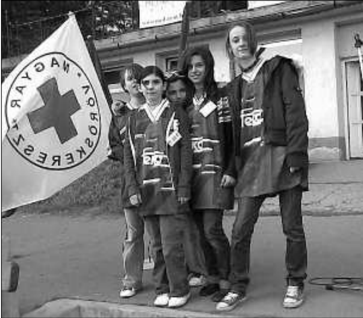
A boldog csapat

Április 26-án 10 órától 14 óráig 16 állomáson teljesítettek jól a versenyzőink. Fáradtan és izgatottan vártuk az eredményhirdetést és reménykedtünk.