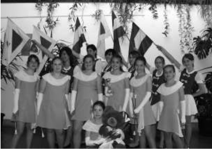
A fesztiválon fellépő táncosok

Megjegyzendő a Lábatlani Mazsorett Csoport vezetőjétől meghívást kaptunk júli. 10-én náluk zajló Mazsorett fesztiválra.