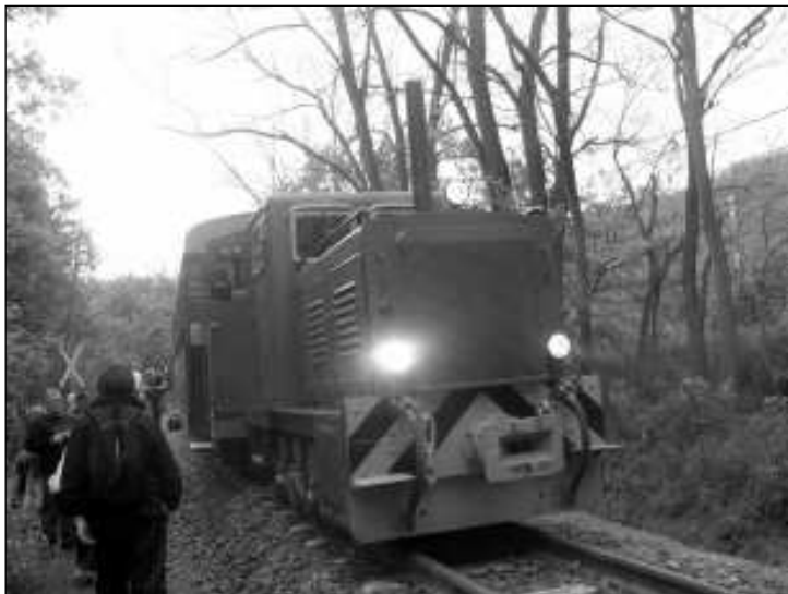
Útban Márianosztra felé. Kalandos volt az utazás

pák még nem működtek, így a rendőrség, és a forgalomirányító személyzet segítette a főúton történő átkelésben. A kertekből a lakók vidáman integettek az utasoknak. Útban Márianosztra felé