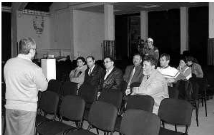
Fórum a kisvasútról. Érdekes dolgok hangzottak el

Azt mindenképpen látnunk kell, hogy egy vezetés nem létezik visszajelzés nélkül. Talán a „néma gyerekek anyja sem érti a szavát” mondás jellemzi a legjobban ezt a helyzetet. Nem elég, ha otthon elmondjuk a véleményünket, ugyanis az nem fog eljutni a megfelelő fű-