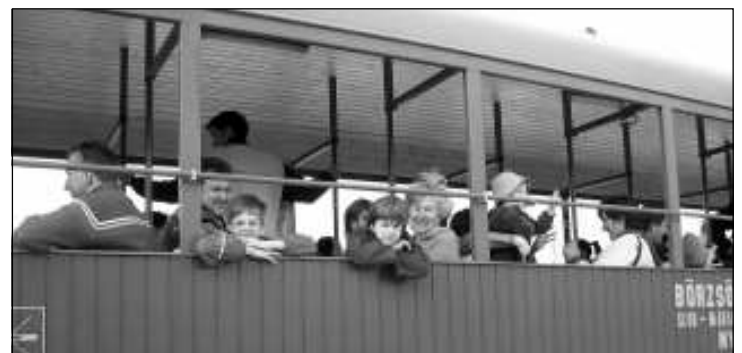
Az utasok élvezték a kellemes nyári időt és a szép tájat

hoz közeledve sajnos egy kanyarnál a kisvasút utasai egy enyhé dőccenést éreztek, majd a szerelvény megállt, és közölték, hogy a kocsik egyik kereke leugrott a sínről. Több utas, és a kisgyere-