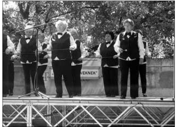
A Nyugdíjas Táncsoport

A Kék csapat sajnos a kevés próba következtében nem tudott kellően felkészülni, így rájuk nem tudtunk számítani. Csak a Piros csapat volt teljes létszámú. Így nyilvánvalóvá vált, hogy a kért időtartamú műsort nem tud-