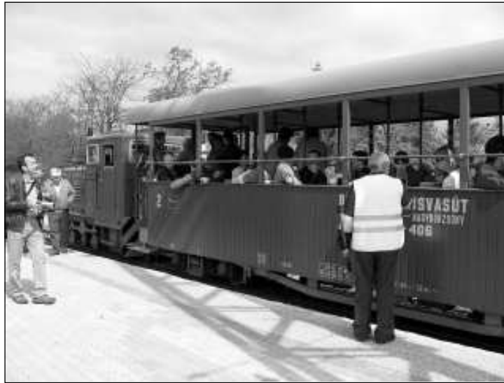
Az első indulásra várva. Hamarosan naponta közlekedik

A kisvasút körülbelül fél 11 tájban indult neki az útnak, gyönyörű időben, egy kocsival, teli utasokkal. A forgalmi jelzőlá-