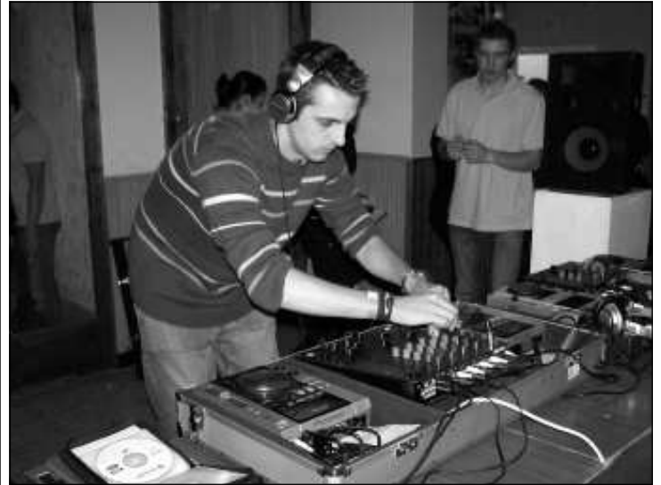
A versenyzők nagyon jól érezték magukat

során különlegességnek számítottak azok a percek, mikor egyszerre hárman zenéltek, három technikán. (Egy buliban általában egy technika áll a DJ-k rendelkezésére.) A zsűri tagjai a szobi ifjúsági