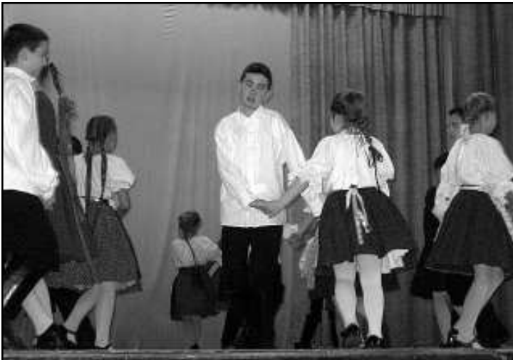
...a nagyok pedig táncoltak

édesanyák emlékét, majd annak végeztével Dsida Jenő és József Attila egy-egy versét szavalta el két ministráns kisleány. Mindkét költőt az édesanyjuk iránt Hazánk területén is több Mária kegyhely van. Ilyen a közeli Nógrád megyében található Mátraverebély-Szentkút is, amelyet főként az Ipoly mentén