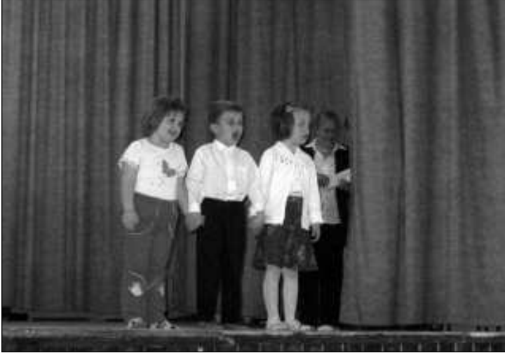
A kicsik verset mondtak...

Május első vasárnapján, anyák napján hálás szívvel köszöntöttük az édesanyákat. A szentmise keretében fájdalommal telve, de Isten akaratában megnyugodva idéztük fel az elhunyt tolikus Egyház naponta imádkozza a lorettói litániát, százezrek keresik fel a búcsújáró helyeket. (Többek között ebben a hónapban tartják Erdélyben a csíksomlyói búcsút is.)