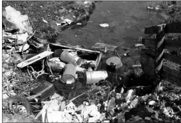
Szükségszerűen szemléletváltásra lesz tehát szükség a településtisztaság területén, ha nem akarjuk, hogy városunkat elborítsa a szemét

a térségben szelektíven gyűjtött hulladékokat, amelyeket szétválogatnak, lebáláznak, majd onnan a hasznosító üzemekbe szállítanak. A kezelőközpont egyéb sajátossága, hogy a háztartási hulladék kezelését nem hagyományos lerakással oldják meg, hanem Európai Unió mintára mechanikai-biológia előkezelést alkalmaznak. Az eljárás során a