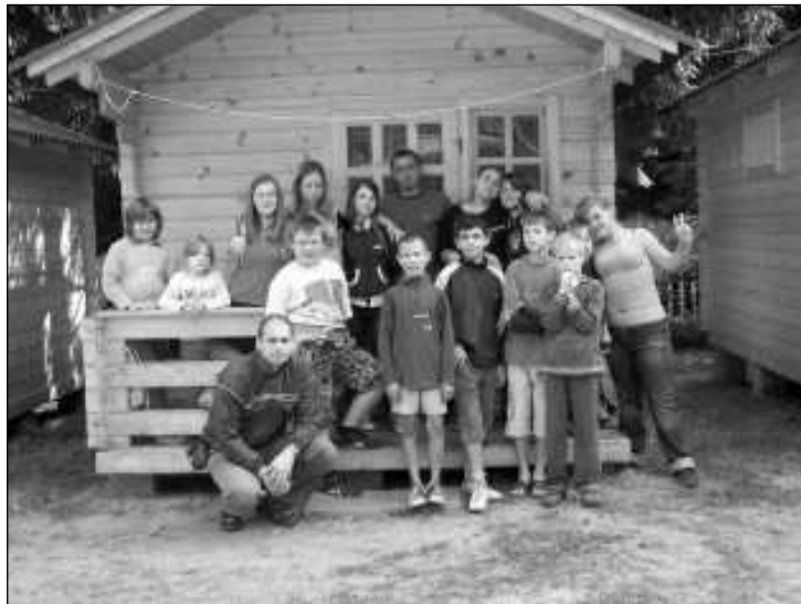
Az augusztusi tábor résztvevői

zésünkre bocsátotta a tulajdonában lévő nyári tábort, illetve annak faházait. Százezer forint összegű, pénzbeli támogatással segítette munkánkat a Pest Megyei Esélyek Háza közelmúltban megnyílt váci irodája. A Magyar Vöröskereszt Pest Megyei Szervezete 170 kilógramm édességgel és 240